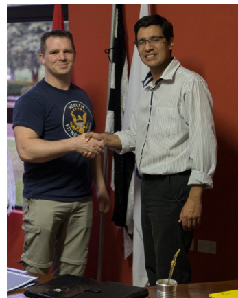
Der Bürgermeister von San Juan Nepomuceno