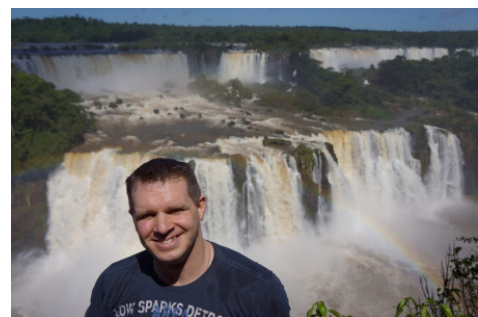
Iguazu - Der größte Wasserfall der Welt