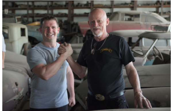
Besuch beim größten Oldtimer-Sammler Paraguays