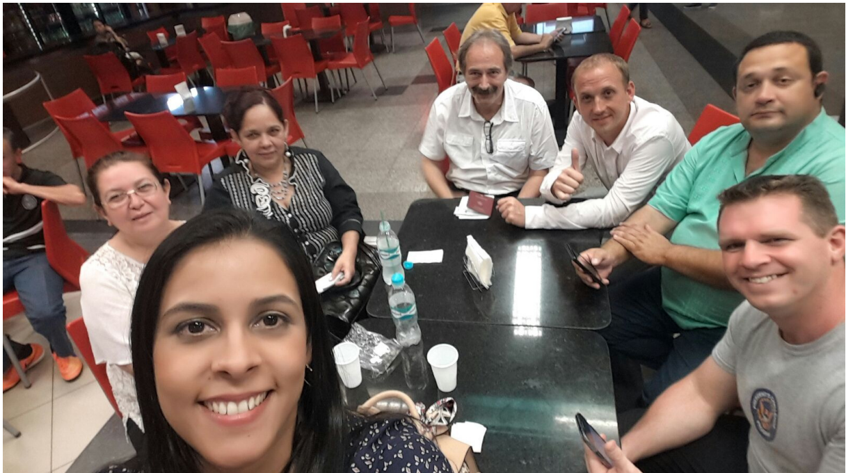
Abreise - Abschlussfoto